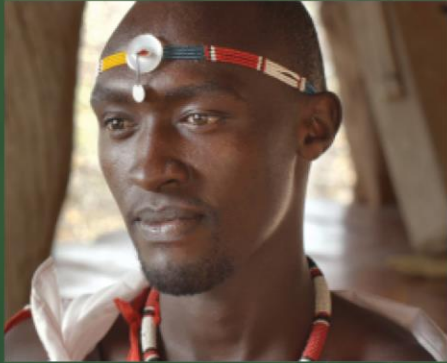
Guerreros Masái africanos que dependen de las vacas para sobrevivir y para su cultura